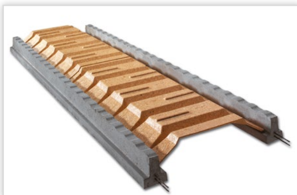
RECTOR, Rectolight. Wypełnienie: panele stropowe z drewna prasowanego. Długość elementu: 120 cm, zastępuje 6 pustaków. Wysokość stropu [cm]: od 16 do 26. Masa: 1 m 2 stropu od 190 kg. Klasyfikacja ogniowa: REI 60. Stosowany we wszelkich budynkach mieszkalnych i użyteczności publicznej, z zastosowaniem sufitów podwieszanych. Uzyskiwane rozpiętości w systemie Rectolight wahają się między 1,8 m do ponad 8,0 m. Łatwość w cięciu i wykonywaniu otworów sprawia, iż jest dopasowany do każdego projektu. Konstrukcja stropu może uzyskać ognioodporność REI 60 (Badanie ITB nr 28818/11/200 NP).