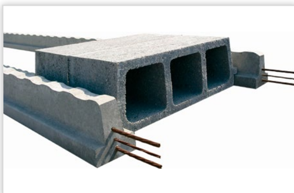
RECTOR, Rectobeton – wypełnienie pustaki z czystego betonu. Wysokość całkowita stropu [cm]: od 14 do 340. Masa: 1 m 2 stropu od 235 kg. Klasyfikacja ogniowa: od REI 60 do REI 240. Stosowany we wszystkich rodzajach budynków, na wszystkich kondygnacjach uzupełnieniem systemu są: zbrojenia przypodporowe, zgrzewane maty siatki stalowej oraz beton monolityczny wylewany na budowie.