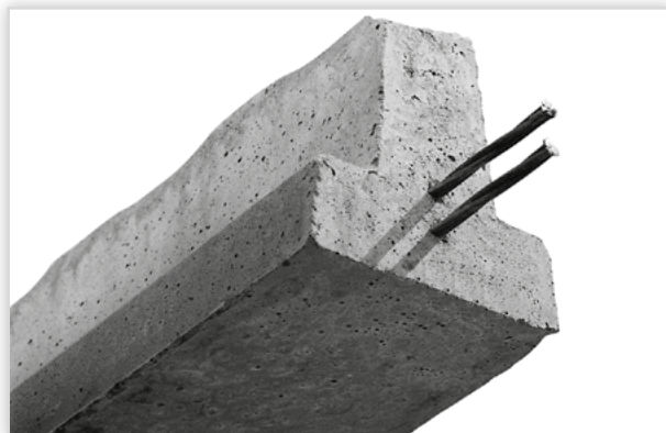
RECTOR, Belki 110-130. Materiał: beton C 50/60. Zbrojenie: stal klasy 2060 MPa. Wymiary (dł./wys./szer.) [mm]: 1-10/110-130/98-105. Rozstaw osiowy [mm]: od 59 do 60.