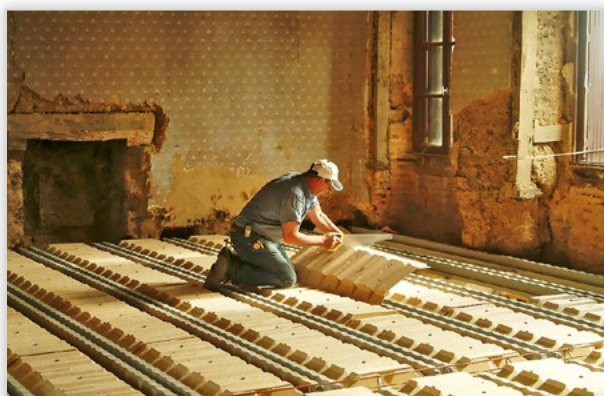
RECTOR, Systemy stropowe RECTOBETON i RECTOLIGHT. Stosowane przy renowacjach. Wymiana stropu charakteryzuje się: łatwością i szybkością montażu, lekkością konstrukcji stropowej – ciężar od 187 kg/m 2 , możliwy montaż bezpodporowy – nawet do 5,8 m, możliwość wykonania wieńca na pierwszym rzędzie pustaków, oparcie belek w gniazdach w ścianach.