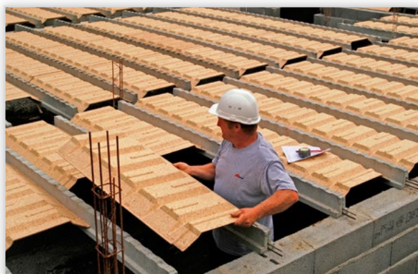
RECTOR, Strop nad przestrzenią wentylowaną. Alternatywne rozwiązanie dla tradycyjnych podłóg na gruncie. Zalety: wentylacja przestrzeni podpodłogowych, eliminacja możliwości popełnienia błędów wykonawczych, zastosowane zamiast tradycyjnej posadzki na terenach gruntów spoiwystych to rozwiązanie łatwiejsze w wykonaniu i bardziej ekonomiczne.